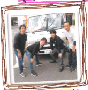
施設外専任の職員

障がい者の皆さまに、安心して過ごせる 住み + 働く 場所をサポートいたします！