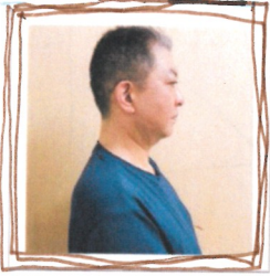
(ミライ河内長野 利用者さん)

ミライで訓練し、一般就労を目標としています。 一般就労に向けて毎日努力して出勤しています。 職場との人間関係のありかた、精神的な面での悩みあり、仕事に対する集中力を高めること、一斉者に作業している人達との協調性を身に付けようと、責任を持つ事を日々訓練して学んでいます。 将来自分の仕事に就きたいので私にとりては、大々的な就労支援施設です。社会人として人から信頼され立派に働けるよう頑張っています。