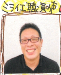
ミライエ 河内長野 (就労支援スタッフ)