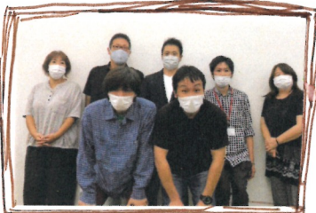
各事業所の管理者・職員